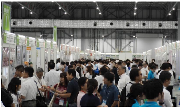
※大学見本市ブース