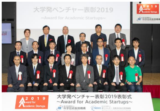
※同時開催 大学発ベンチャー表彰 2019 の表彰